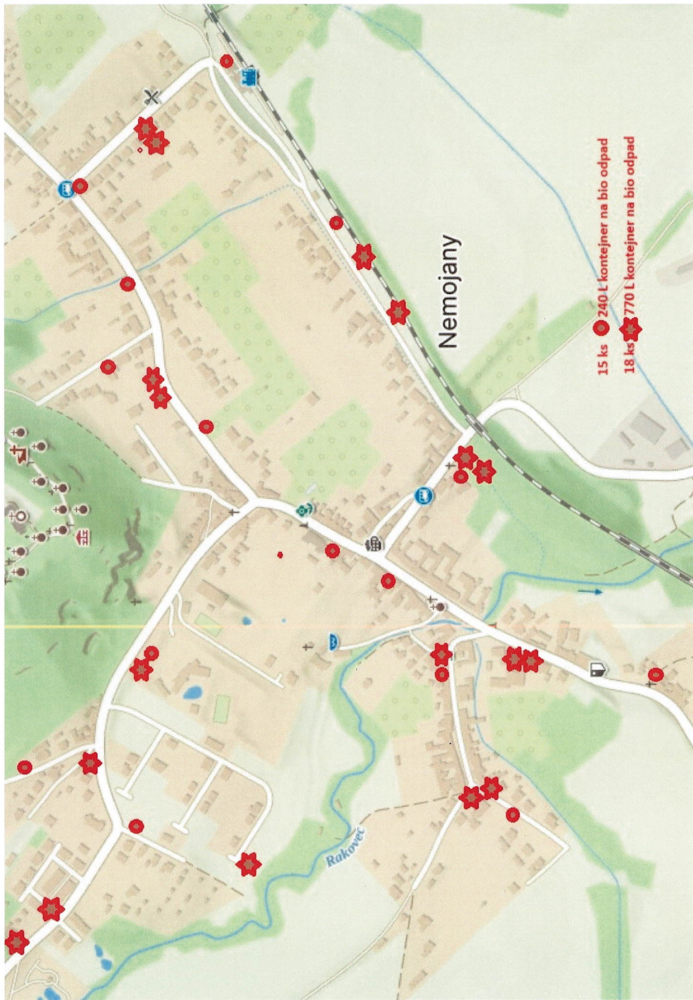
Mapka ke sběrným místům – nádoby na BIO ODPAD – 240L 15ks, 770L 18ks