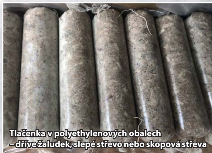
Tlačenka v polyethylenových obalech – dříve žaludek, slepé střevo nebo skopová střeva

V době, kdy se řezník věnoval porcování masa, odřezal také kůži a tuto určený „dobrovolník“ oholil strojkem na holení, kůže opral a dal je vařit, například do druhého kotle. Tyto kůže se po uvaření pomlely a přidaly se do prejtu nebo tlačanky. Do tlačanky se dalo libové maso, menší část tučného, trochu bílé polévky, již zmíněné uvařené kůže na zrosolovatění a koření – strouhaná cibule, česnek, mletý pepř, mleté nové koření, majoránka a sůl. Někde se dává čerstvá krev, paprika, játra nebo jiné koření. Vše záleží na zvyklostech a oblasti bydlení. Vaříme ve vodě teplé asi 85°C po dobu 90–120 minut, před tím propícháme jehlou, aby unikl vzduch.