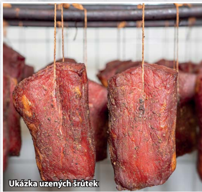
Ukázka uzených šrůtek

Poslední, co zbývá, než se začne uklízet, je naložení masa na uzení. Zde se to řídí podle toho, čemu se dá přednost, více na spotřebu nebo na uzení. Můžeme udit sádlo na slaninu, bůček, kýtu, krkovičku, žebra, plec. Porcováním se připraví „šrůtky“ masa, to se naloží do škopku se slaným lákem, na Moravě i s česnekem a nechá se v chladnu zaležet. Pokud možno 4–6 týdnů. Poté se může udit. Fajnšmekři si odřežou z naloženého masa na řízky, které jsou chuťově nepřekonatelné.