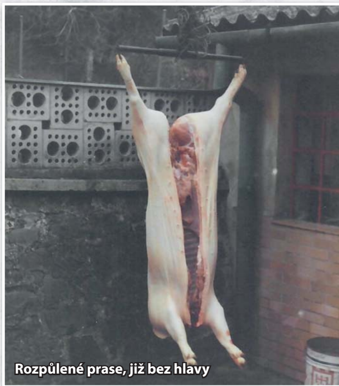
Rozpůlené prasce, již bez hlavy

Prasce v zavěšení je připravené na tzv. vyvrhnutí, to je rozříznutí spodní části těla svisle dolů a vyjmutí vnitřností, včetně střev.