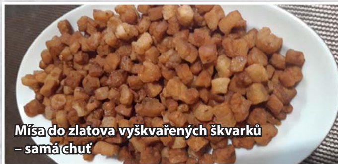
Míša do zlatova vyškvařených škvarků – samá chuť

chání se krátce nechají zbarvit do zlatova a vše je hotovo. Hlavně se nesmí nic připálit, na druhé straně nesmí být sádlo vodnaté. Vše záleží na zkušenostech a praxi.