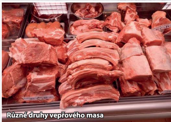
Různé druhy vepřového masa

Mezi tím řezník pokračuje v práci s kusem visícího vepře. Rozsekne jej na dvě podélné půlky. Dříve se odstraňovala velká část kůže ze hřbetu tzv. krupon, který se musel odevzdat státním úřadům. Nyní se toto již nedělá, kůže se stejně musí odřezat, neboť pod ní se nachází sádlo. Dřívější druhy prasat byly spíš sádelnaté, dnes jsou především masové, takže sádla mají méně. Po ořezání hřbetního sádla se pokračuje porcovaním rozdělných půlek. Řezník dělí maso podle druhů: Krkovička, Plecko, Vepřová pečeně, Panenská svíčková, Žebra, Bůček, Plec (horní, dolní šál a ořech), Kýta, Koleno, Nožičky a Ocásek. Toto je z jedné půlky, stejně tak z druhé, mimo ocásek. Uděláme tzv. výřad, tak jak na mysliveckém honu. Všechny tyto díly se rozloží na čistém místě, aby mohly volně vychladnout.