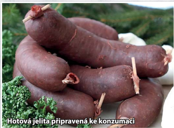
Hotová jelita připravená ke konzumaci

ně drobů, škvarků z vnitřního sádla, vařených krup, části masné polévky a krve. Krev může být vařená (potom tolik bouřku neobarví), nebo část vařená a část syrová, či úplně syrová, která dobře směs obarví a také polévku, kde se zašpejlované jitrnice ve střevech ovaří. Necháme přejít varem a dovařujeme asi 30 minut při mírnější teplotě. Při výrobě jelit nesmíme zapomenout na ochucení kořením, dává se mletý pepř, mleté nové koření, mletý kmín, majoránka, osmažená cibule, sůl, někde i česnek. To vše v určitém poměru. Tak jak jsou zvyklosti s krví, tak jsou i s kroupami. Někde můžou být nahrazeny vařenou rýží. Přidány mohou být také osmažené, na kostky nakrájené rohlíky. Vše záleží na rodinných a krajových zvyklostech. „Černá“ polévka, u nás trdelnice, někde prdelačka a jiné názvy, která vznikne po vaření jitrnic, se musí dochutit. Jitrnice se vyjmou z kotle a ochladí ve studené vodě, rozloží se na dřevěnou desku, aby se nezapařily. Jsou hotové.