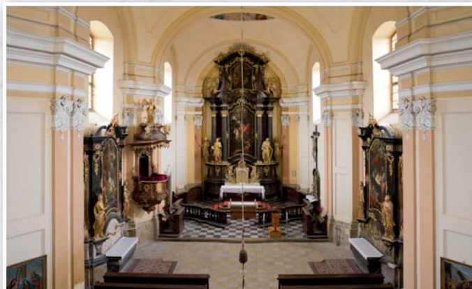
Pohled na Chrámovou loď s hlavním oltářem