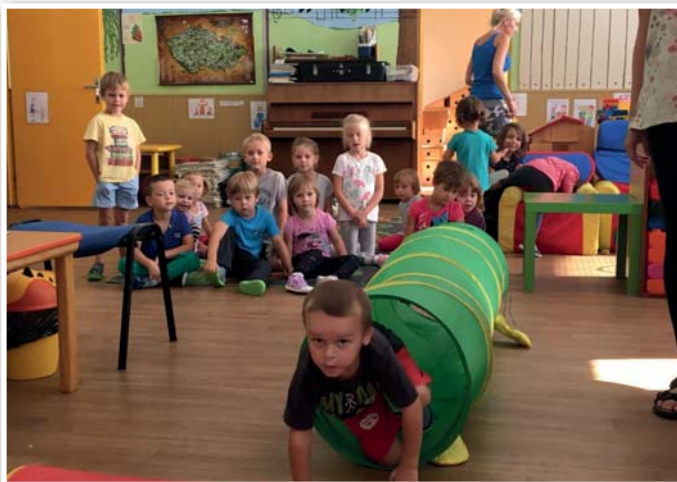
Děti v MŠ