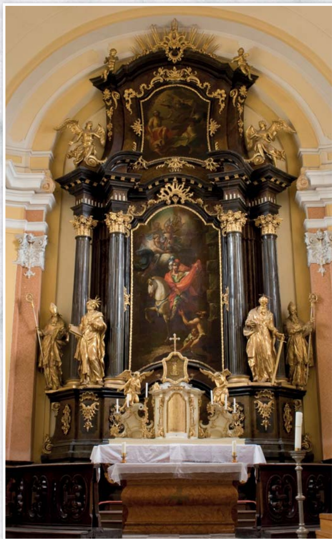
Hlavní oltář s obrazem sv. Martina uprostřed. Sochy zleva: sv. Cyril, sv. Petr, sv. Pavel a sv. Metoděj

Cyril (Konstantin) výška 215 cm – filozof, několik misí, umírá v Římě, kam oba bratři odešli z Moravy, je pohřben v kostele sv. Klimenta. Atributy: mnišský hábit, kniha