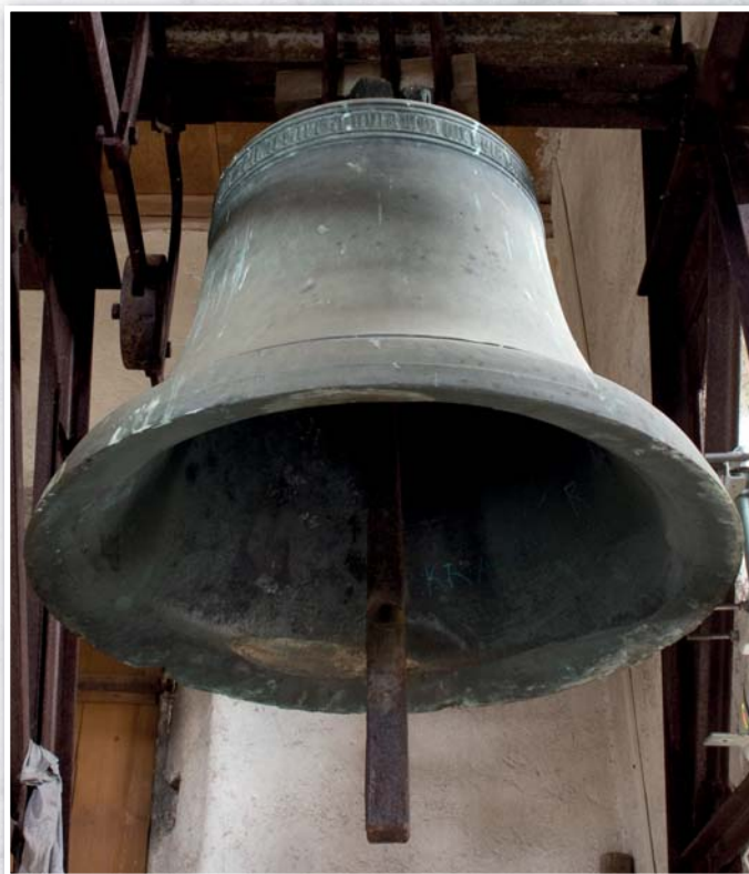
Historický zvon z roku 1510 zasvěcený Královně nebes - přežil všechny útrapy až do dnešních dnů