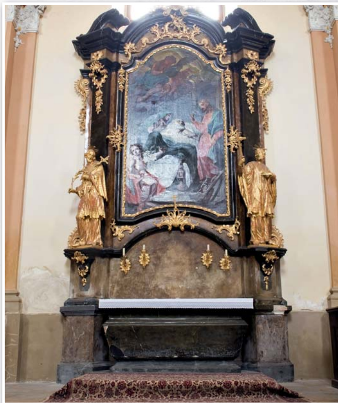
Boční oltář sv. Josefa (pravá strana kostela) se sv. Janem Nepomuckým (vlevo) a sv. Janem Sarkandrem (vpravo)

Nyní si řekneme něco o jednotlivých postavách těchto našich světců, kteří se nacházejí v našem kostele.