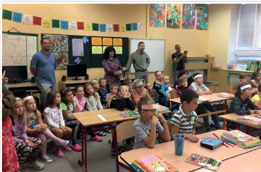
Slavnostní zahájení školního roku 2018/2019

Školní rok byl zahájen i v mateřské škole, kterou letos navštěvuje