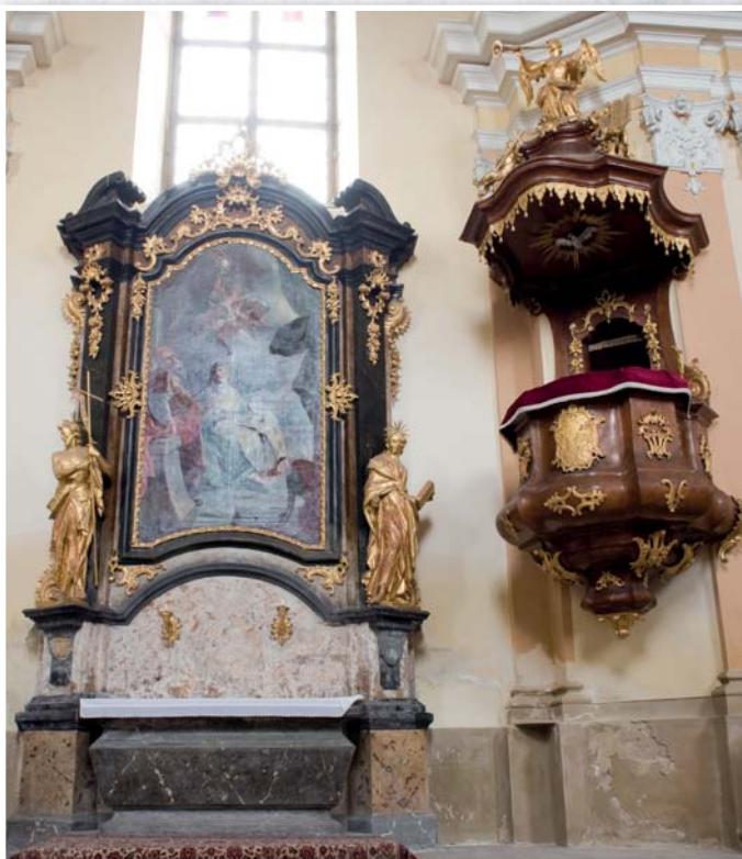
Boční oltář sv. Anny (levá strana kostela) se sv. Janem Křtitelem (vlevo) a sv. Janem Evangelistou (vpravo)

V lulečském kostele sv. Martina se na hlavním oltáři nachází u pat sloupů apoštolská knížata Petr a Pavel a věrozvěstové Cyril s Metodějem. Spojení apoštolů Moravy s prvními apoštoly křesťanské víry nebylo v baroku neobvyklé. Orientace soch je následující (v pořadí zleva): sv. Cyril, Petr, Pavel a Metoděj. V nástavci je zobrazena sv. Trojice, po stranách jsou oranti – v = 80 cm (orant – postava se zdviženými rukama v modlitebním prosebném gestu) a nad nimi andělci – v = 60 cm – zobrazení jako nemluvnata.