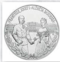
Stříbrná mince Františka Josefa I. a jeho manželky Alžběty Bavorské (Sisi)

Ještě se krátce vrátíme do roku 1879, kdy 24. dubna oslavila Jejich Veličenstva císař František Josef I. (*18. srpna 1830 †21. listopadu 1916) a císařovna Alžběta Bavorská – Sisi (*24. prosince 1837 †10. září 1898) stříbrnou svatbu.