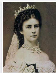
Alžběta Bavorská (Sisi) – manželka rakouského císaře Františka Josefa I.

nuta tříhranným pilníkem, italským anarchistou Luigi Lucheni.