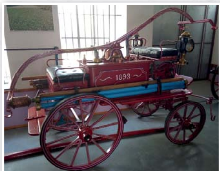
Hasičská stříkačka z doby založení místního dobrovolného sboru