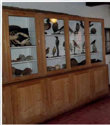
Ukázka uložení školních sbírek ve staré škole (ilustrační foto)