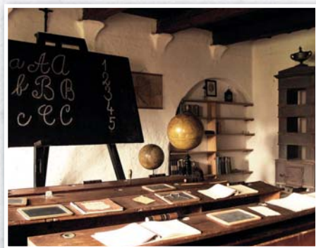
Ukázka třídy ve staré škole (ilustrační foto)