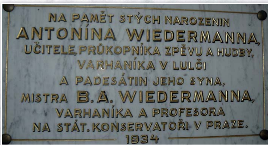
Pamětní cedule na varhanní skříni v kostele sv. Martina v Lulči