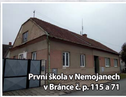
První škola v Nemojanech v Bránce č. p. 115 a 71