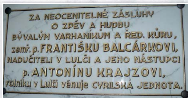
Druhá pamětní cedule na varhanách u sv. Martina v Lulči