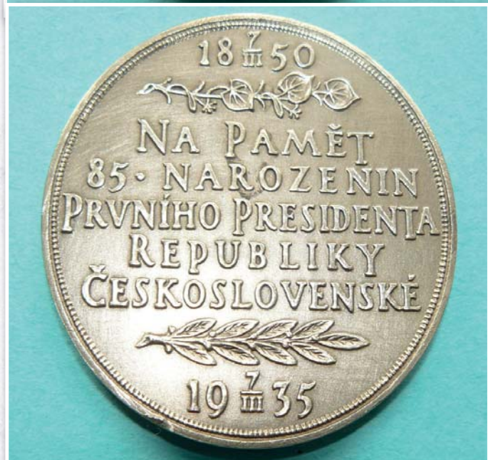
Pamětní medaile k 85. výročí narození T. G. Masaryka