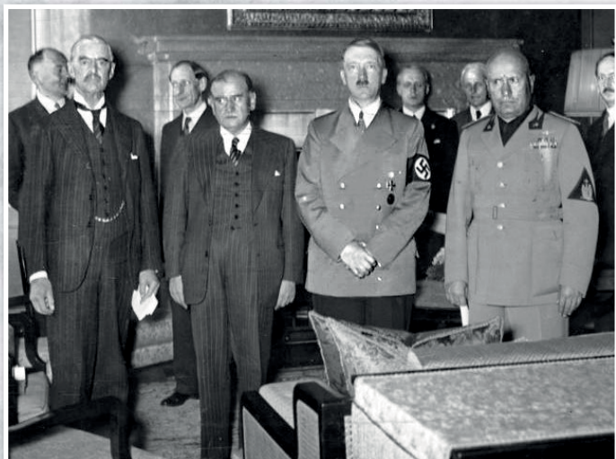
Tito politici rozhodli o nás: zleva Neville Chamberlain (Anglie), Édouard Daladier (Francie), Adolf Hitler (Německo) a Benito Mussolini (Itálie). Mnichov 30. 9. 1938

Školní rok 1940–41 byl ve znamení velkých změn. Začalo to regulací knihoven, jak žákovské, tak učitelské. Byly vyřazeny knihy našich i cizích spisovatelů, mapy a obrazy odevzdány na okresní úřad. Zbytek pak uzamčen a zapečetěn ve skříni, knihy ke čtení zakázány půjčovat. K narozeninám Hitlerovým byla nařízena sbírka všech kovů, nebyla valná, byla donesena na úřad ve Vyškově.