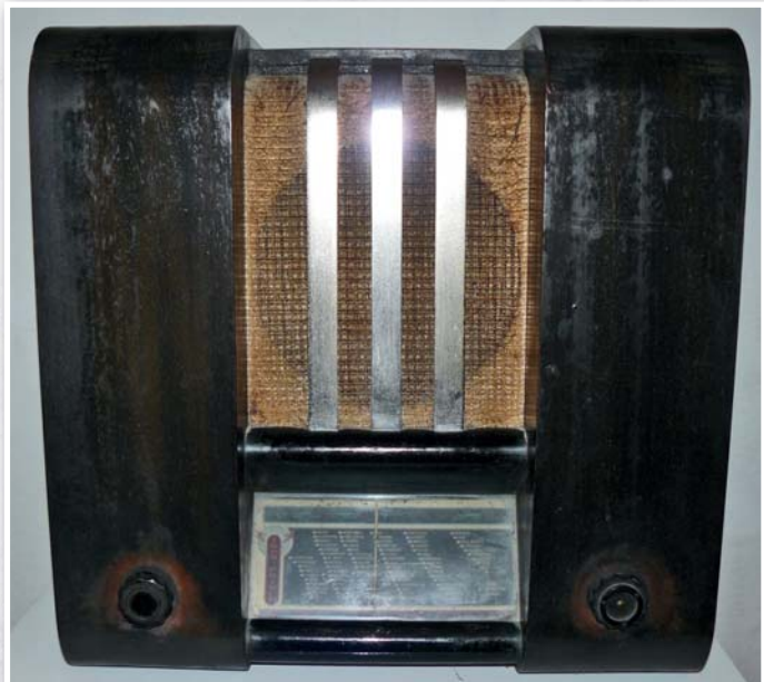
Rozhlasový přijímač zn. IRON Prince ze 30. let 20. století